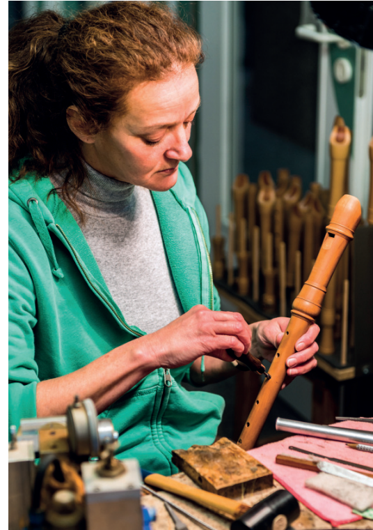
Der letzte Schliff kommt von Hand

ist der europäische Markt verglichen mit dem Weltmarkt?