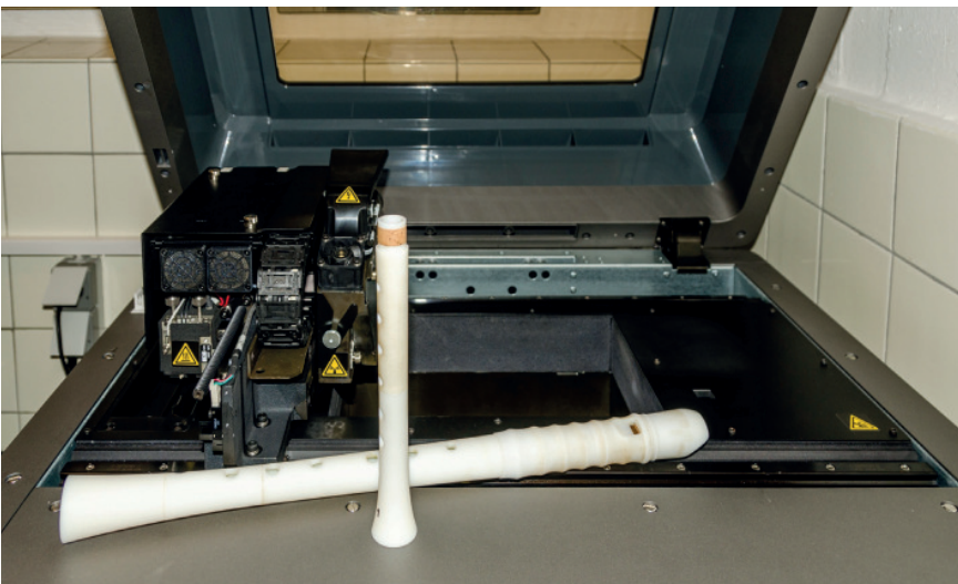
Man investiert aber auch in neues Gerät wie in einen 3D-Drucker...